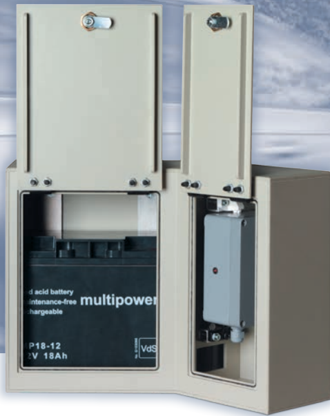
Abmessung und Gewicht: 37 x 26 x 23 cm (B x H x T), ca. 3 kg Hinter den abschließbaren Frontklappen befinden sich der Radardetektor und der Akku.