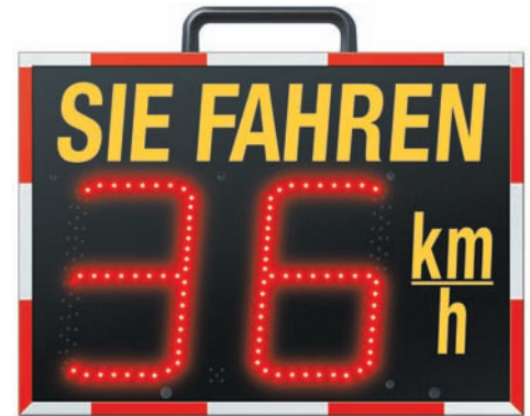
Rote LED-Anzeige bei Geschwindigkeitsüberschreitung

Abmessung: 541 x 448 x 100 mm (B x H x T) Gewicht: 8,5 Kg